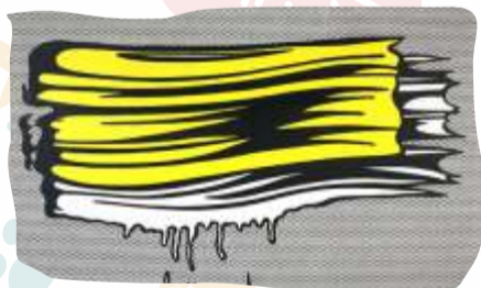
Рой Лихтенштейн. Белые и желтые мазки кистью Модель Botie («Боти»), модель 54