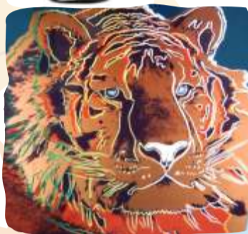
Энди Уорхол. Тигр Модель Taylor («Тейлор»), модель Edie («Эди»)

В новой коллекции представлен еще один вариант этой анималистической расцветки. Бело-рыже-коричневая гамма меняет первоначальную идею и напоминает нам о горячих песках, жарком солнце и роскошном мехе хищного тигра.