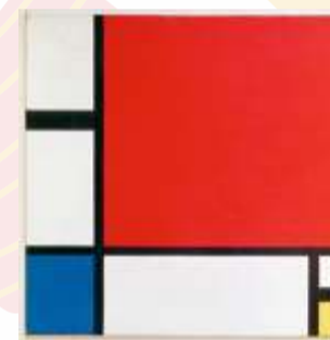
Пит Мондриан. Композиция с красным, синим и жёлтым Модель Mondrian («Мондриан»)

Сумка-багет или, как ее еще называют boxbag, – несомненный хит весенней коллекции.