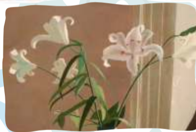
Дэвид Хокни. Мистер и Миссис Клар и Перси, фрагмент Модель Moon («Мун»)

Экзотический цветок магнолии, выполненный в акварельной технике, кажется небрежно забрызганным каплями свежей краски. Это придает нежному рисунку живость, динамику и выразительность. Использование в принтах подобных «брызг» – один из модных трендов наступающего сезона. Например, как в модели сумки «Мун» (в переводе с английского – «луна»).