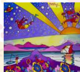
Питер Макс. Сделайте каждый день земли Модели Capri («Капри»), Miracle («Миракл», по-английски «Чудо»)

Яркие платки, созданные из 100% шелка, завораживают необычным рисунком. Фантазия художника объединяет несоединимое и предлагает отправиться в мир, где на дне океана расцветают розы, а подводные жители празднуют рождение новой жемчужины – сумки из коллекции Eleganza.